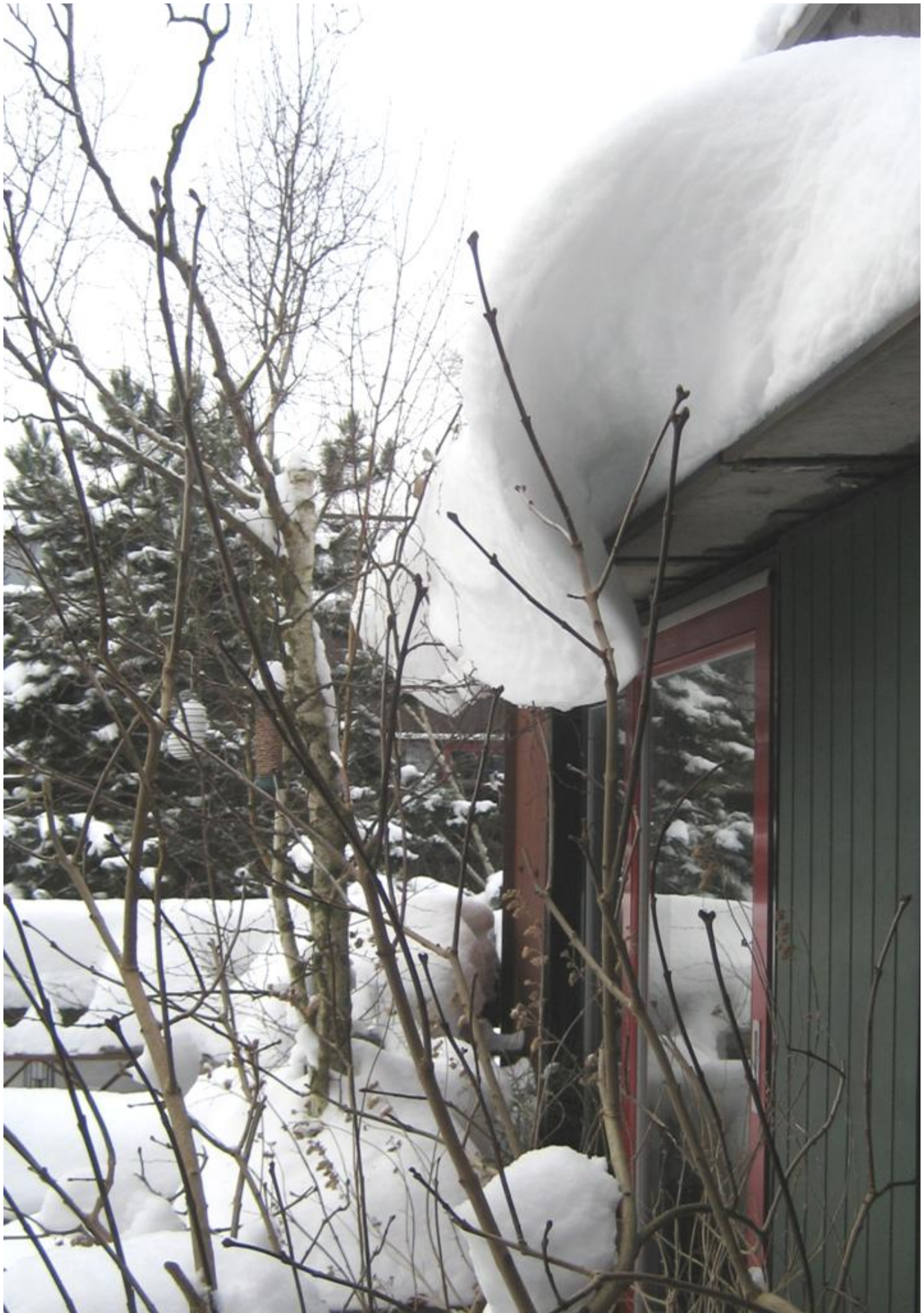
28.12.2010 - Mon vi får sådan en vinter i år?