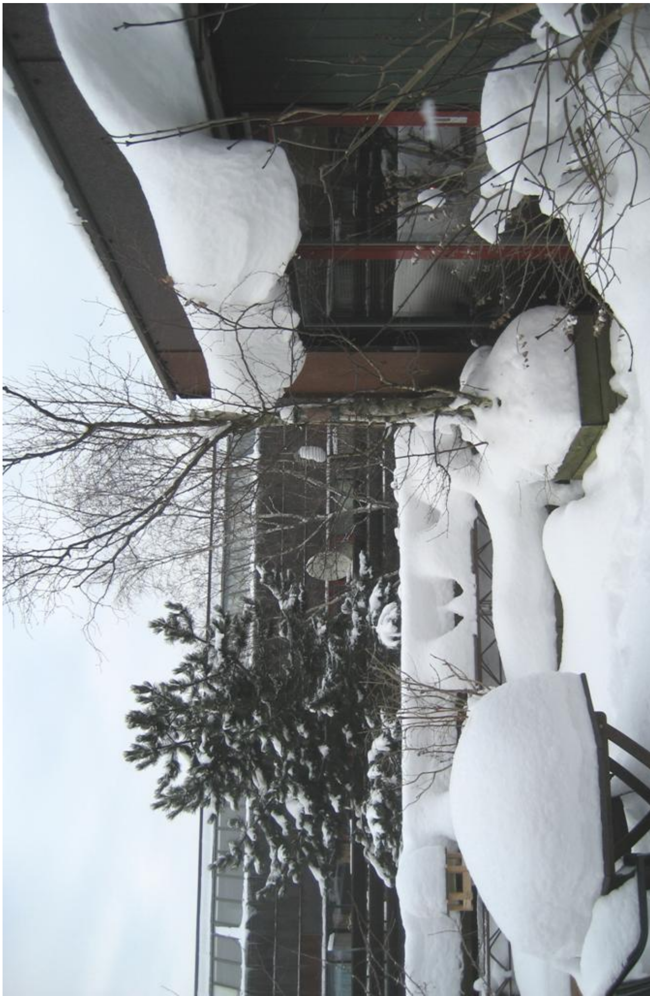
28.12.2010 – D-terrasse druknet i sne