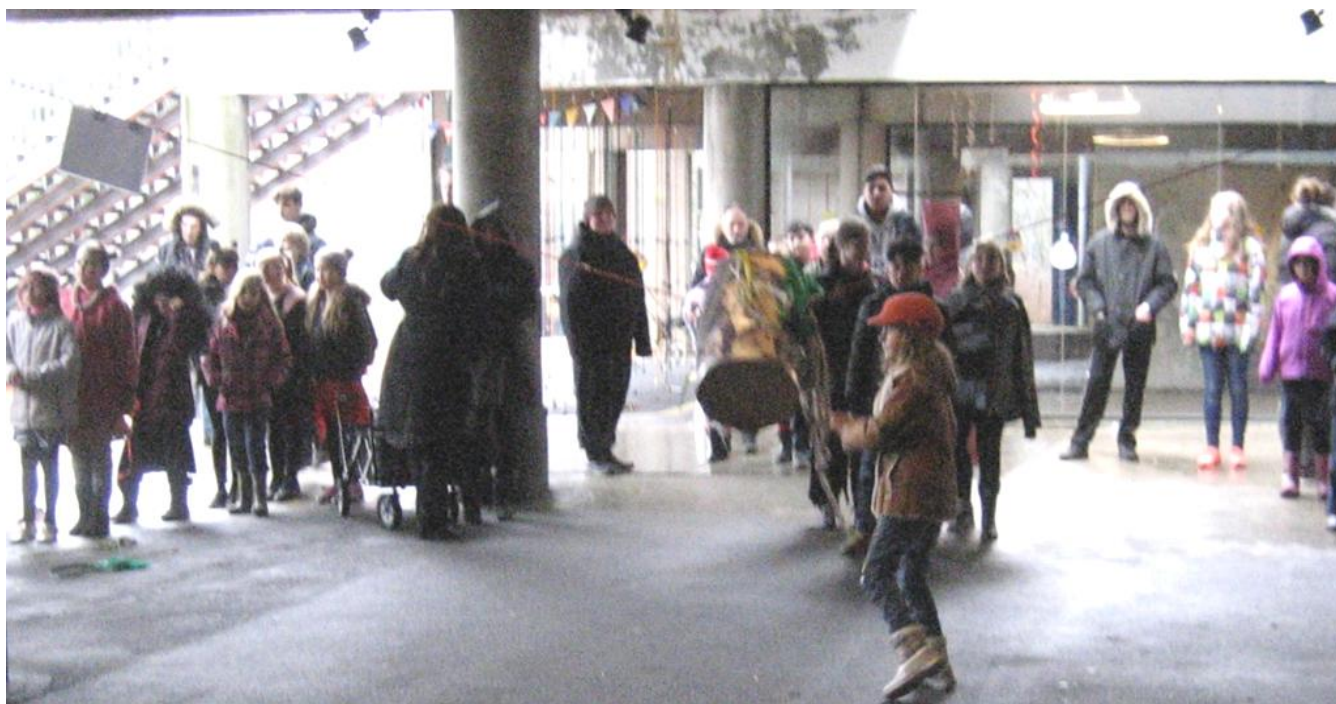
26.02.2017 – BUUs fastelavnsfest ved Aktivitetspladsen