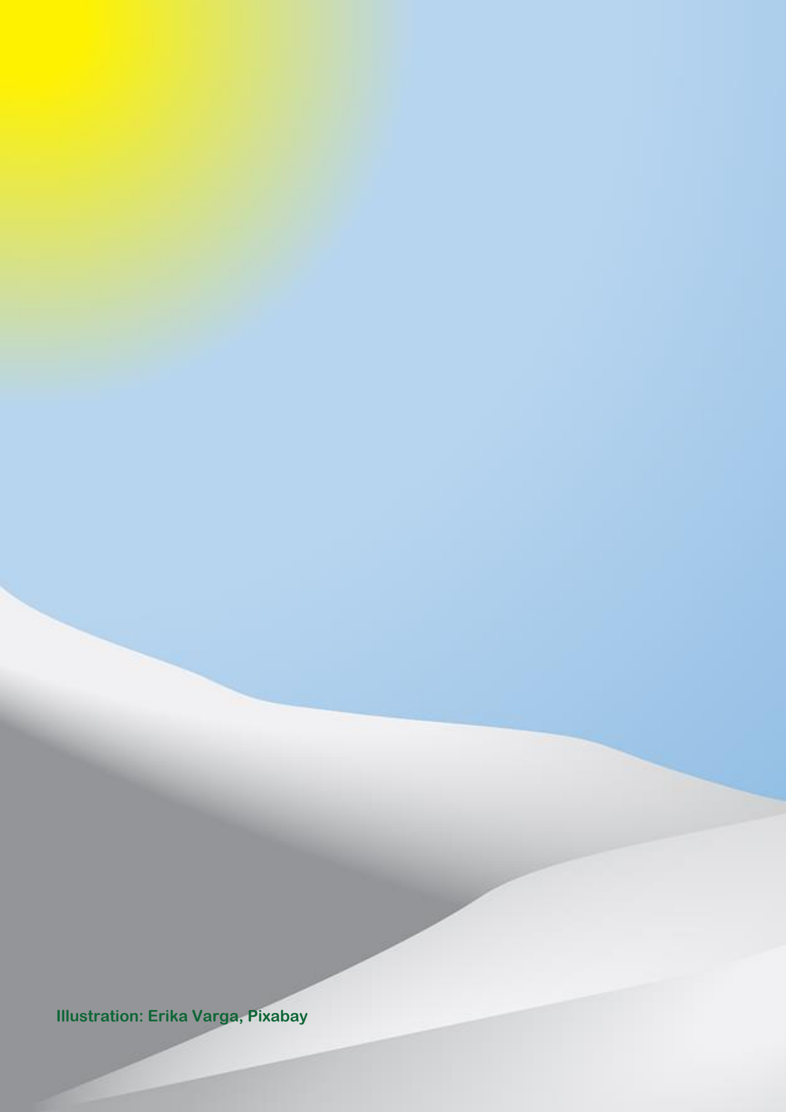
Illustration: Erika Varga, Pixabay