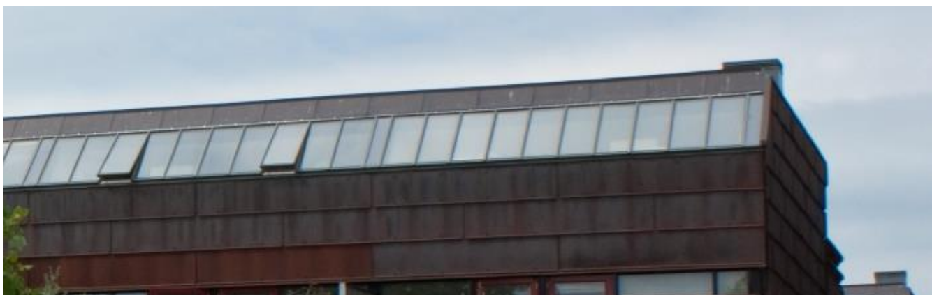
2.R – Skrålysbånd