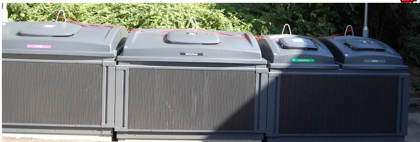
29.06.2020 - Indvielse af pilotprojekt