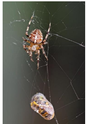
Byttet trækkes op

Da hvepsen var forsvarlig bundet, satte edderkoppen en tråd fast i den. Så kravlede den op til midten af sit spind, alt imens den forlængede tråden, således