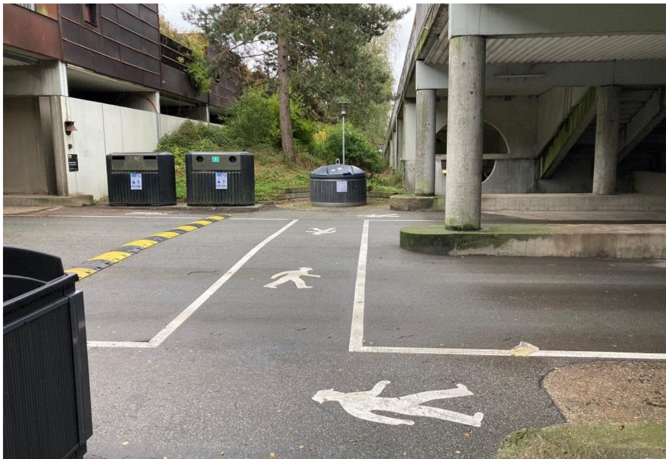
26.10.2023 - Fodgængerrammer ved blok 11

Vejbump blev monteret i uge 40, og opmærkning af fodgængerzoner arbejdes der på. Arbejdet forventes færdigt i uge 46.