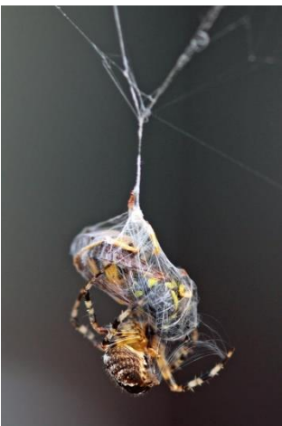
Byttet pakkes ind

Det tog mig ca. 15 sekunder at løbe ind, finde mit kamera, sætte et makro-objektiv på og komme ud igen. Men da var kampen forbi. Edderkoppen havde stukket sit bytte med sin giftkrog, som egentlig er en del af overmundens. Den havde frigjort hvepsen, og som en øvet