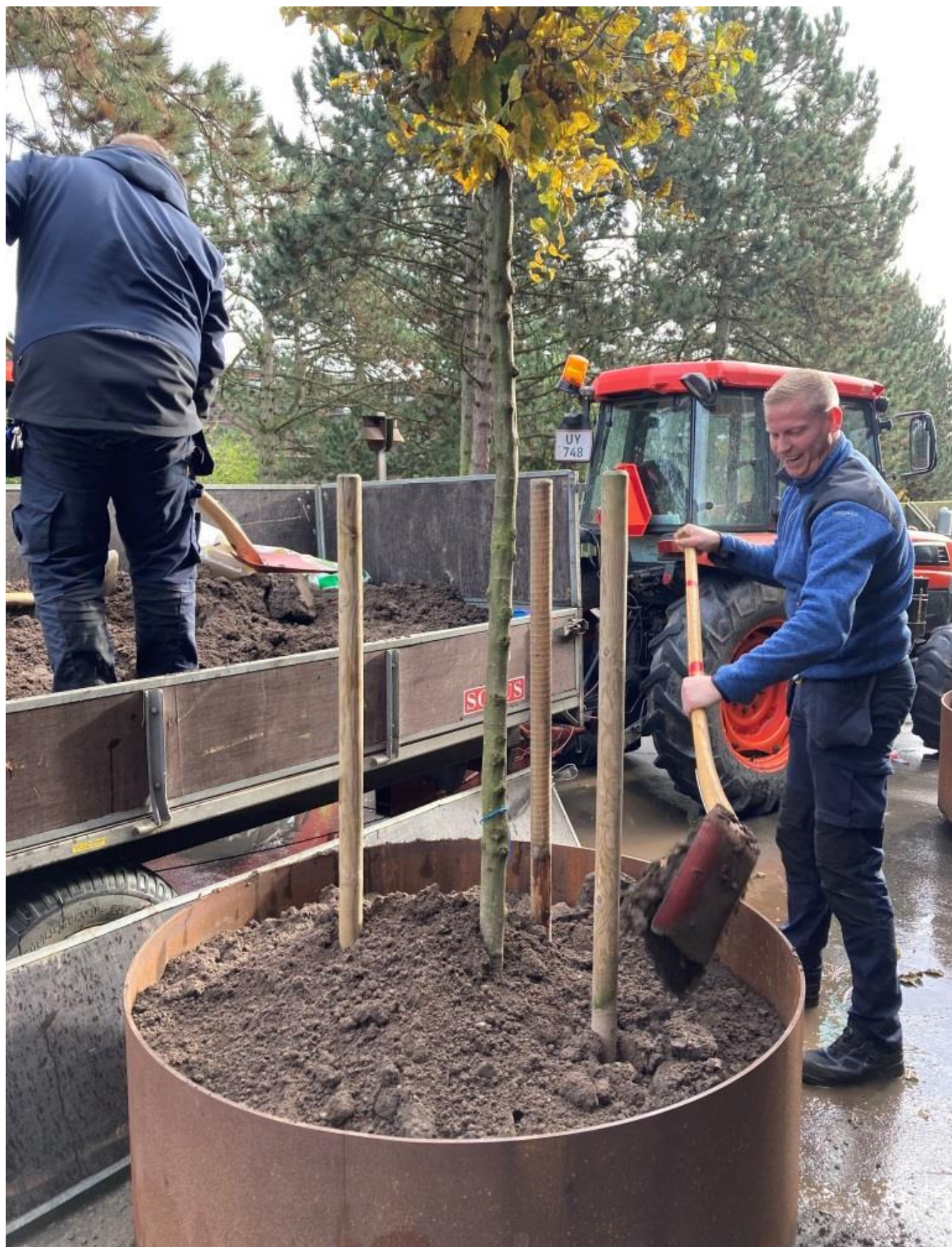
08.11.2023 - Cortenkummerne beplantes

Vi er gået i gang med at udskifte de gamle plantekummer på vestblokgangstrøget. De nye kummer er udført i cortén, og der plantes nye træer i dem. ❤️