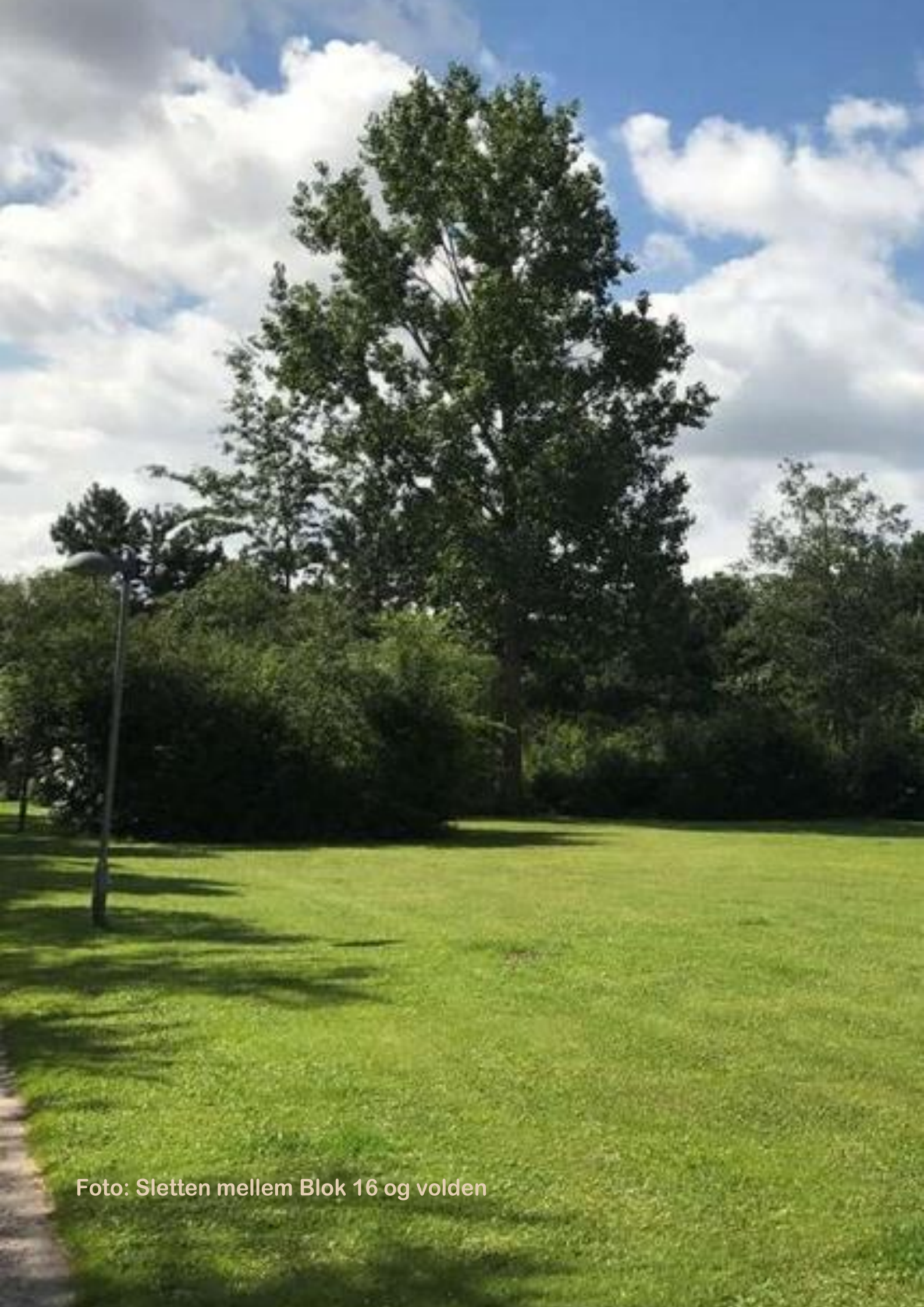
Foto: Sletten mellem Blok 16 og volden