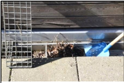
Løft ristene og rens renderne

Det er vigtigt jævnligt at rens afløbene på terrasserne. Når der kommer store mængder af vand, skal afløbene være rene, så vandet kan løbe væk fra terrassen. Når du rens afløbene, må du ikke bruge skarpe genstande, da det kan beskadige underlaget. Se her, hvordan du rens afløbene under ristene.