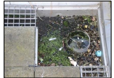
Løft risten og rens afløbet

Det er vigtigt jævnligt at rens afløbene på terrasserne. Når der kommer store mængder af vand, skal afløbene være rene, så vandet kan løbe væk fra terrassen. Når du rens afløbene, må du ikke bruge skarpe genstande, da det kan beskadige underlaget. Se her, hvordan du rens afløbene under ristene.