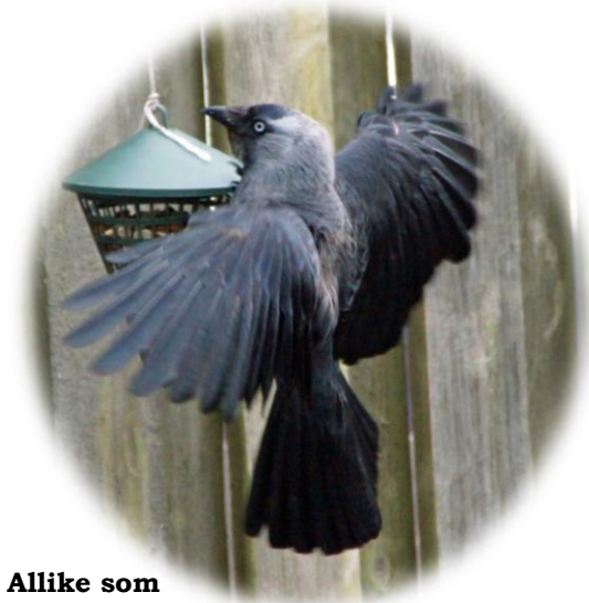
Allike som leger mejse