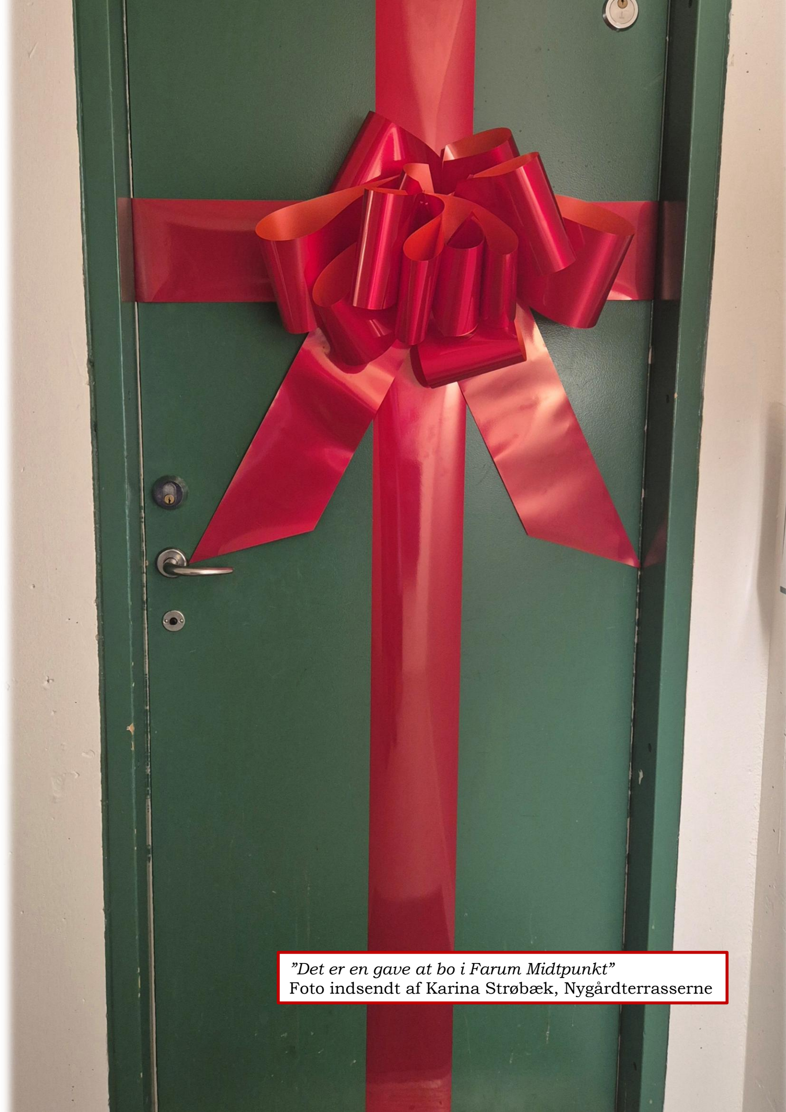
"Det er en gave at bo i Farum Midtpunkt"