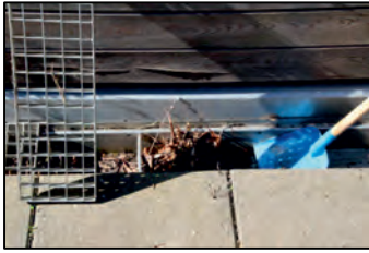
Løft ristene og rens renderne.

Ejendomskontoret har modtaget en del henvendelser om vandskade, så driften opfordrer til, at man tjekker afløb og riste på sin altan, og renser dem, hvis de er tilstoppede, så vi undgår vandskade på boliger/bygninger. Se hvordan du gør her: