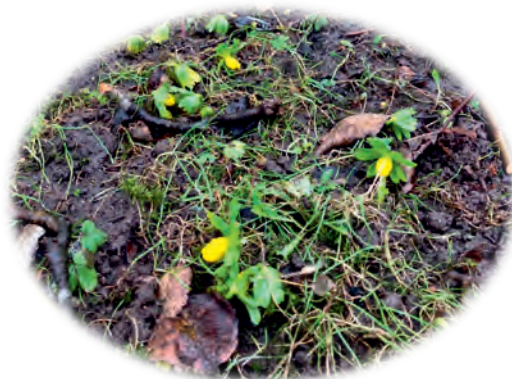
Forårets første erantis, marts 2026

Thomas/TMU gør opmærksom på, at der er TMU-møde den 11. marts.