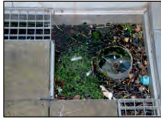
Løft risten og rens afløbet.